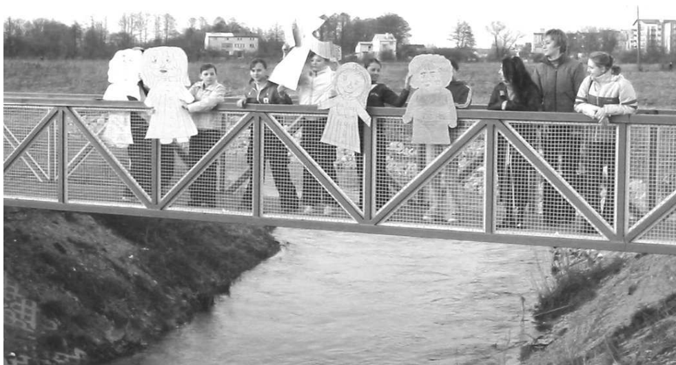
Klub „Alternatywa i opiekunowie.

O tym, że jest już wiosna świadczy wiele, między innymi to, iż przyleciały do Polski bociany i szpaki, kwitną krokusy, zawilce, przebiśniegi, a nawet niedźwiedź doszedł do wniosku, że to już czas i trzeba wstawać. Wiosna to również pora, która wywołuje u uczniów odruch zwany „ wagarami ”, przez co później mają problemy z ocenami. Ale nie ma tego złego, co by na dobre nie wyszło, dlatego korzystajmy, taki już urok wiosny.