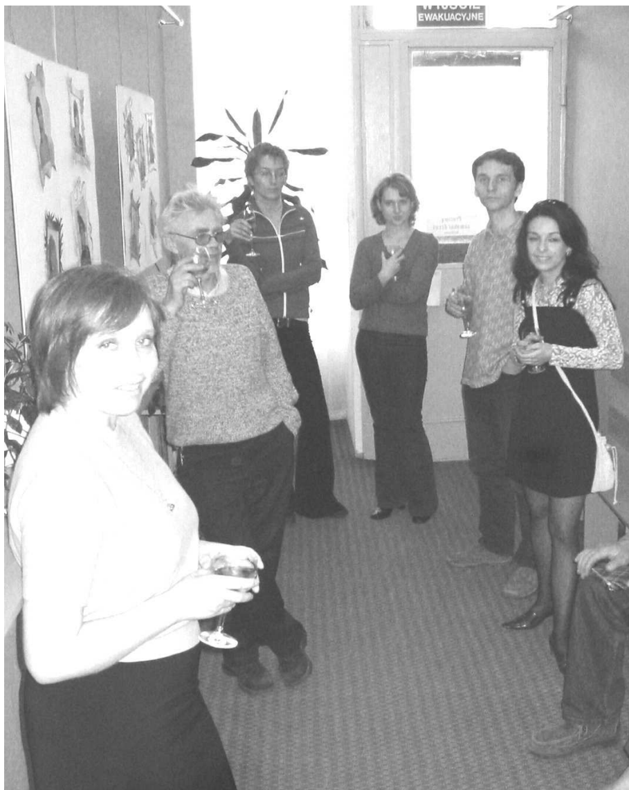
Oryginalna kadra MDK w trakcie wernisażu.

Jeśli ktoś chciałby zobaczyć tą wystawę zapraszamy serdecznie do MDK.