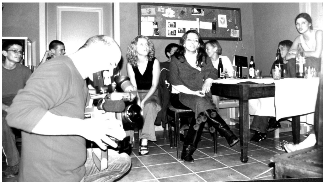
Uczestnicy projektu na wyjeździe w 2003 r.

W październiku natomiast młodzież z MDK wyjedzie do Thale realizować projekt niemiecki.